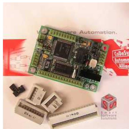
Рис. 3 Микропроцессорный МЭК контроллер

Принципиально новым решением для отечественного рынка является серия микропроцессорных МЭК контроллеров разработанная совместно компаниями «Пролог» и «Каскод». Фактически это те же контроллеры, но оснащенные встроенной системой поддержки программирования МЭК 61131-3 CoDeSys SP. В комплект поставки включен CD с системой программирования CoDeSys, подробной документацией, набором библиотек и лицензией изготовителя. Наличие лицензии гарантирует техническое сопровождение.