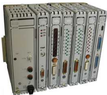
Рис. 1 ПЛК

Иногда контроллеры (ПЛК) путают с микроконтроллерами. На самом деле это принципиально разные вещи. Микроконтроллер это микросхема, ПЛК это законченное изделие в корпусе (См. Рис. 1). Выходы ПЛК способны коммутировать токи до десятков ампер, оснащены гальванической развязкой, защитой от перегрузок, средствами самодиагностики. Определение ПЛК и основные его характеристики описаны в международном стандарте МЭК 61131-1 [2].